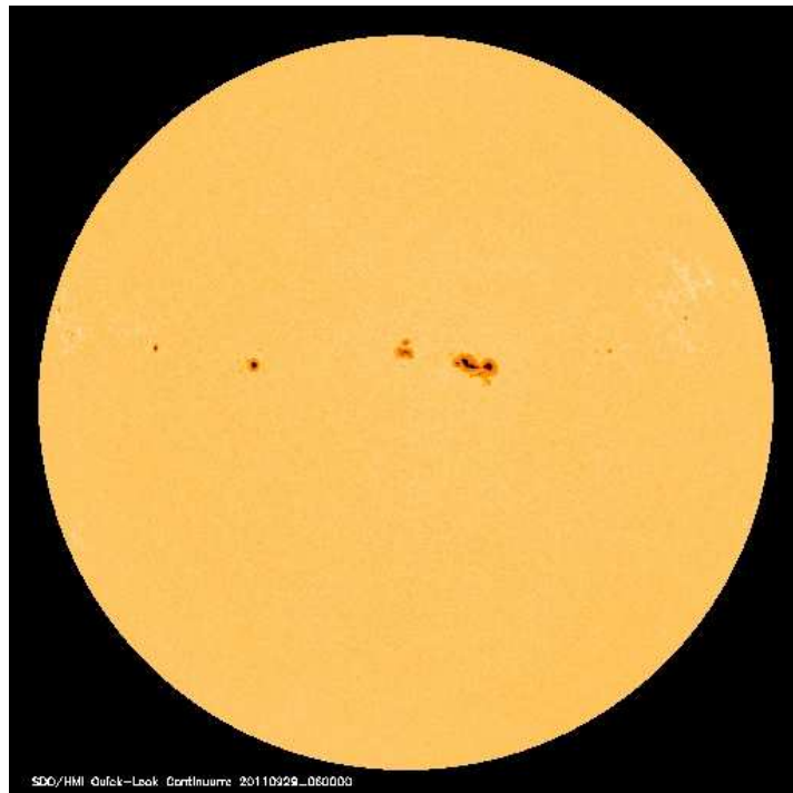
Il Sole ripreso dal telescopio spaziale SOHO (Solar and Heliospheric Observatory) il 29/09/2011 alle ore 06:00 TU.

Ricordiamo di non osservare mai direttamente il Sole senza adeguata protezione : questo può causare danni gravissimi alla vista fino alla cecità completa; con strumenti ottici, comprese macchine fotografiche e binocoli, si deve osservare esclusivamente utilizzando filtri professionali adeguati.